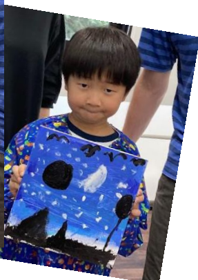
アクリルペイントのグラデーションに挑戦 ✨