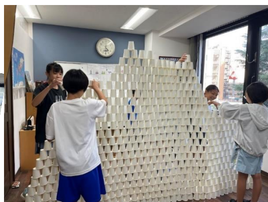
紙コップで巨大 タワーに挑戦 🎵