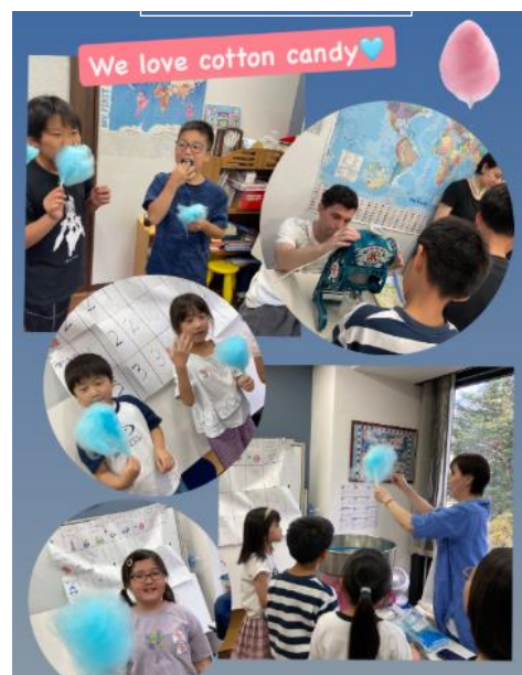
最後は、綿菓子、かき氷、 アイスで締めくり ☺