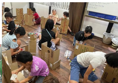
SDGs工作 廃材を使ったマールラン製作 (ビー玉転がし工作)