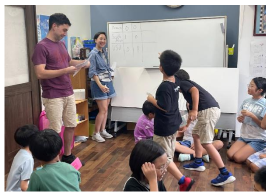
チーム対抗クイズ大会は大盛り上がり!!