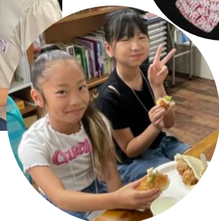
ランチのクッキングは、 ハニーマスタードチキンサンド、ハムサンドと デザートにクレープ

その他、ダンス、英語クイズ、じゃんけん大会、エアホッケーゲーム、紙飛行機投げ等、子ども達がワクワクする体験がいっぱいでした。子供たちの笑顔を見て、私たちスタッフも本当に楽しい 2 日間でした。