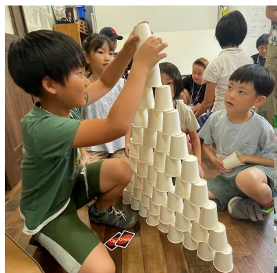
チームビルディングゲーム カップとカードを使ってタワー の高さを競い合いました！